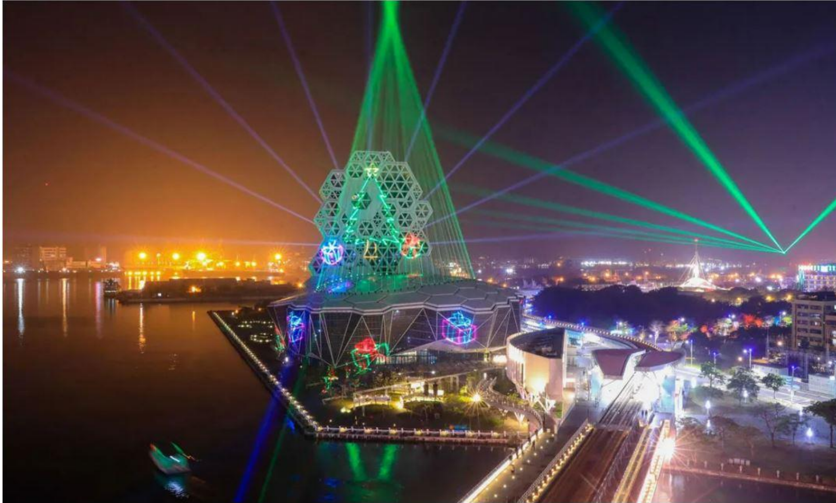
高雄流行音樂中心建築燈光投射打造絕美聖誕主燈。